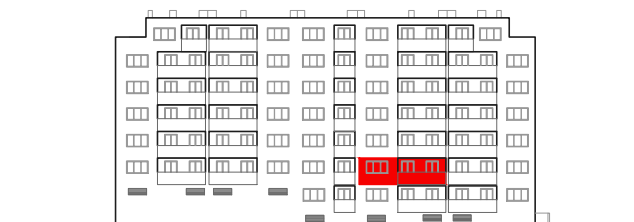
položaj stana na pročelju sjever

STAMBENO - POSLOVNA ZGRADA DUBRAVA CENTAR Dankovečka bb / Dubrava / ZAGREB