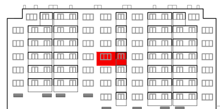
položaj stana na pročelju sjever

STAMBENO - POSLOVNA ZGRADA DUBRAVA CENTAR Dankovečka bb / Dubrava / ZAGREB