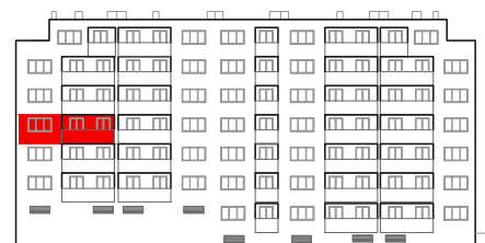
položaj stana na pročelju sjever

STAMBENO - POSLOVNA ZGRADA DUBRAVA CENTAR Dankovečka bb / Dubrava / ZAGREB