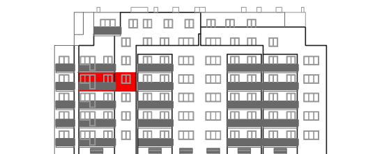
položaj stana na pročelju jug

STAMBENO - POSLOVNA ZGRADA DUBRAVA CENTAR Dankovečka bb / Dubrava / ZAGREB