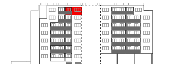
položaj stana na pročelju jug

STAMBENO - POSLOVNA ZGRADA DUBRAVA CENTAR Dankovečka bb / Dubrava / ZAGREB