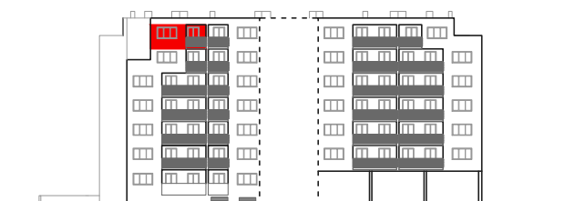
položaj stana na pročelju jug

STAMBENO - POSLOVNA ZGRADA DUBRAVA CENTAR Dankovečka bb / Dubrava / ZAGREB