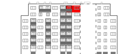
položaj stana na pročelju sjever

STAMBENO - POSLOVNA ZGRADA DUBRAVA CENTAR Dankovečka bb / Dubrava / ZAGREB