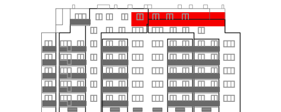
položaj stana na pročelju jug