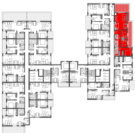
položaj stana na tlocrtu 6. kata